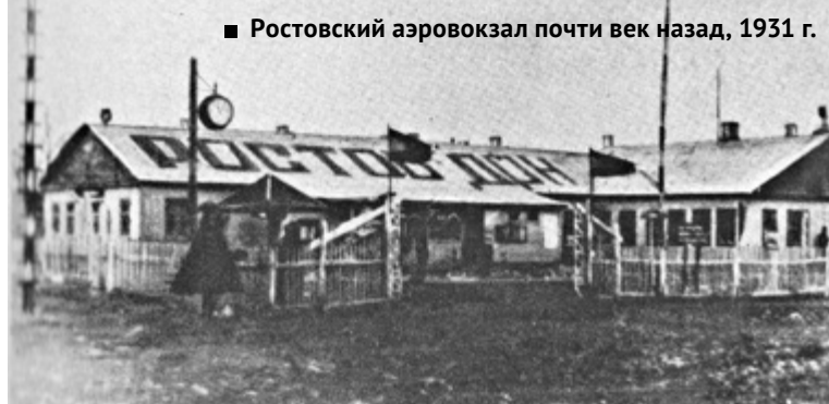
■ Ростовский аэровокзал почти век назад, 1931 г.

В 1934 году была построена первая взлетно-посадочная грунтовая полоса в Цимлянске.