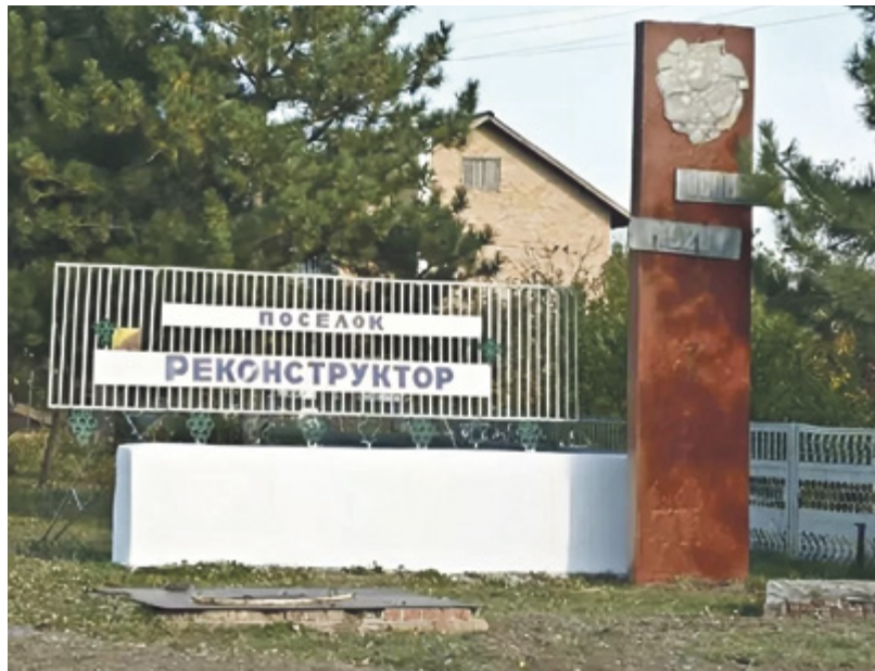
■ У поселка славное прошлое и трудное настоящее

От виносовхоза остались обширные винные погреба, которые могли бы стать туристическим объектом и даже маленьким музеем вина, но сегодня заваливаются мусором. Одним словом, огромный потенциал этого благословенного места с богатым прошлым никак не используется. Почему же так?