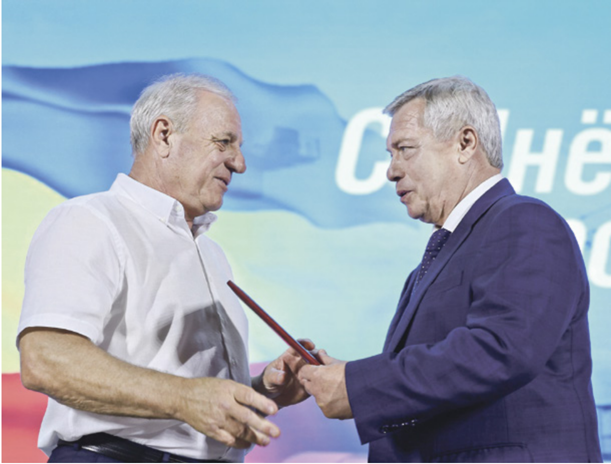
■ Губернатор вручил отличившимся специалистам награды и поощрения Ростовской области, а также знаки «Лучший строитель Дона»