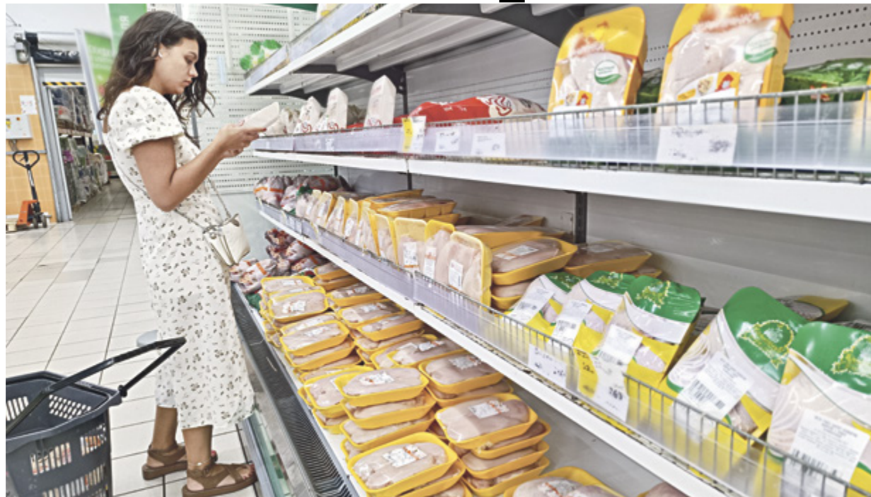
■ В 2024-м потребление мяса в России может увеличиться до 83 кг на человека в год