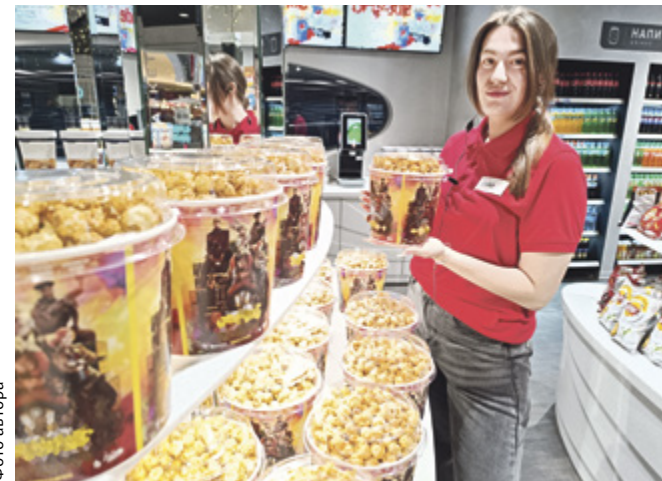
■ Попкорн остается любимым кинолакомством зрителей