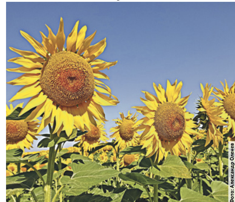
■ Традиционную красоту подсолнечника может испортить серая гниль