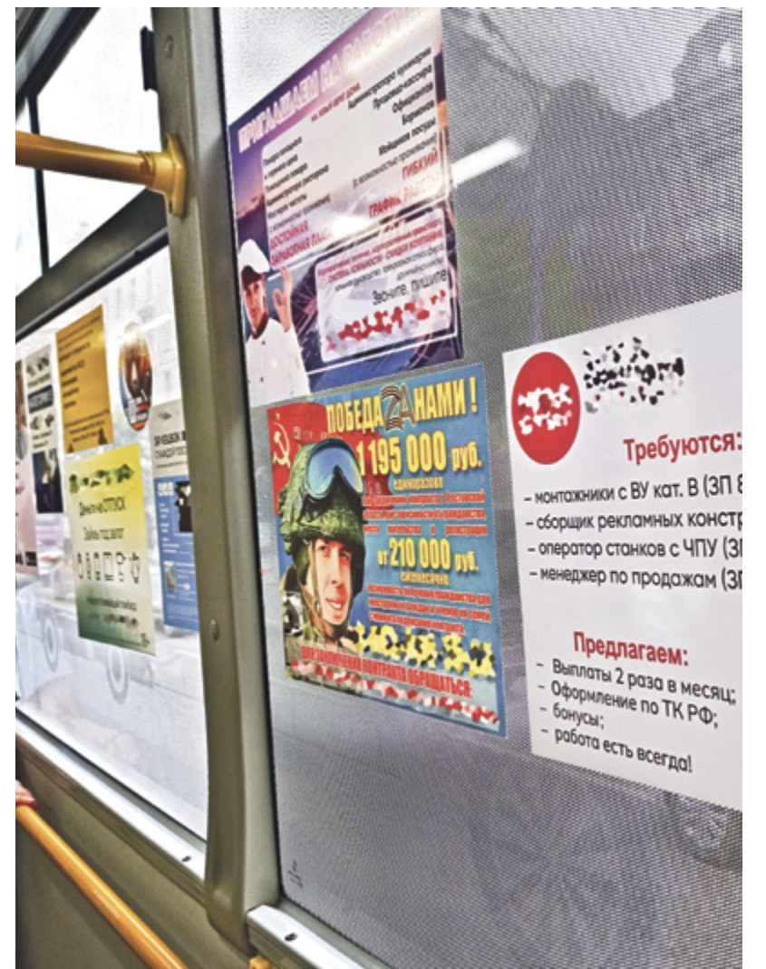
■ Такая «галерея» не редкость в городском общественном транспорте Ростова

Размещением рекламы на автобусах и маршрутках донской столицы занимается целый ряд фирм. «Реклама в городском транспорте охватывает всю социально активную аудиторию. Разместите рекламу вашей компании в маршрутке или автобусах, и о вас узнает весь город!» – уговаривают рекламодатели коммерсанты. Те ведутся, но результат получается плачевным.