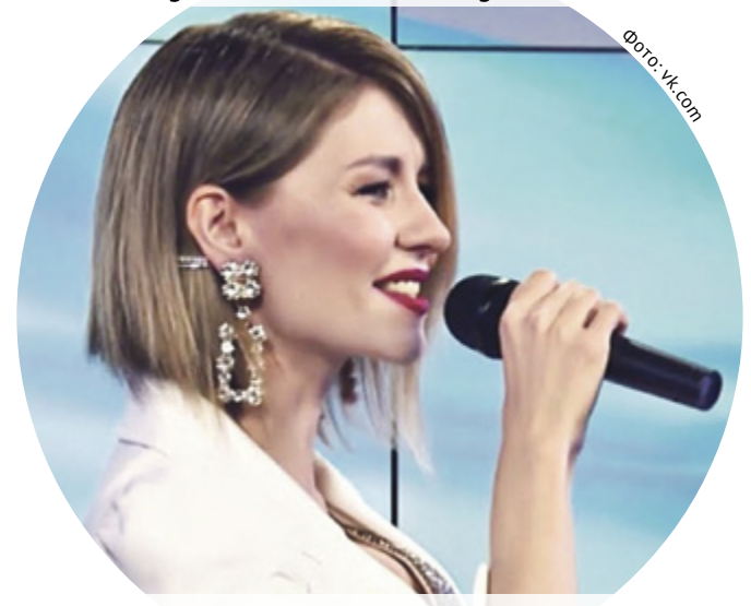
■ За победу в «Катюше» могут побороться только представительницы прекрасного пола