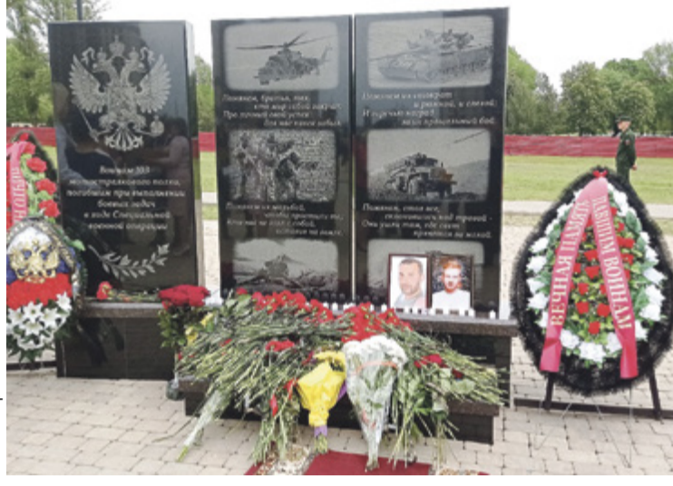
Мимо нового памятника торжественным маршем прошла рота почетного караула, а затем к черным плитам возложили цветы

В расположении воинской части, дислоцированной в Ростове-на-Дону, открылся мемориал бойцам, погибшим в ходе специальной военной операции.