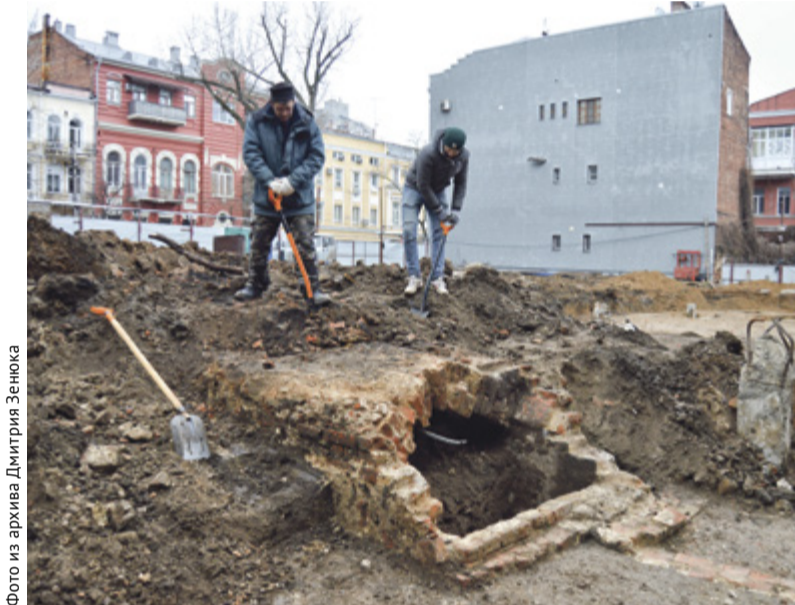
На месте раскопок в перулке Семашко было обнаружено и подземелье непонятного предназначения

В соответствии со ст. 15.1 Федерального закона от 24.07.2007 № 101-ФЗ «Об обороте земель сельскохозяйственного назначения» участником общей долевой собственности на земельный участок с кадастровым номером 61.22.0600015.230, адрес (местоположение): Ростовская обл., р-н Миллеровский, с. северной, северо-восточной, восточной, юго-западной, западной, северо-западной, южной сторон от с. Ольховый Рог, балка Капаньянская, балка Ближний Яр, настоящим извещением уведомляются о месте и порядке ознакомления с проектом межевания земельного участка.