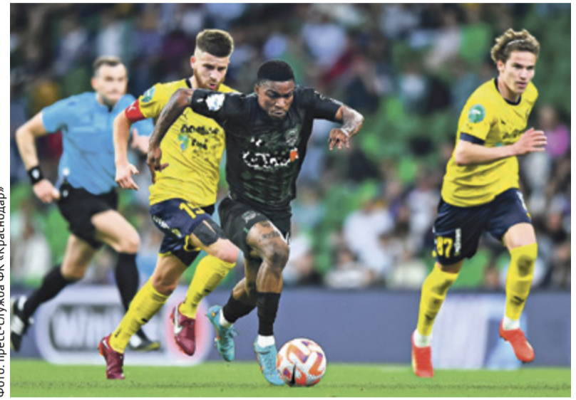
«Желто-синие» пропустили уже на третьей минуте матча

Футбольный клуб «Ростов» в гостях проиграл «Краснодару» со счетом 0:3. Ростовчане уступили в трех играх подряд.