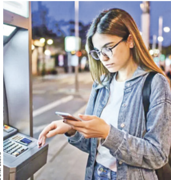
Подростки уязвимы из-за высокой активности в Сети и использования мошенниками геймификации

Исходя из информации в СМИ, история с похищением 14-летнего подростка из Красноярска и 18-летней девушки не совсем стандартна для современных телефонных мошеннических схем. Во-первых, она специально приехала из Сургута для совершения кражи, а для этого требуется время, в течение которого можно осмыслить, что вообще происходит, и прекратить идти на поводу у мошенников, вовремя остановиться и прекратить связь. Во-вторых, одновременная обработка 14-летнего подростка, который стал соучастником кражи первой суммы у своих же родителей и дальнейшей инсценировки похищения для получения еще большей суммы. В-третьих, перечислив средства мошенникам, часть денег из полученной суммы они оставили себе. Мошенники специально блокируют критическое мышление и используют когнитивные искажения, повышающие уязвимость, такие как эффект срочности, «когнитивная перегрузка» (поток информации), эффект авторитета (инструкции исходят от «высшего источника»). Кроме того, блокируют и максимально отдаляют от родственников типичной техникой «изоляция жертвы», при этом кардинально подменяя мотивацию действий и ролей. Кражу и об-