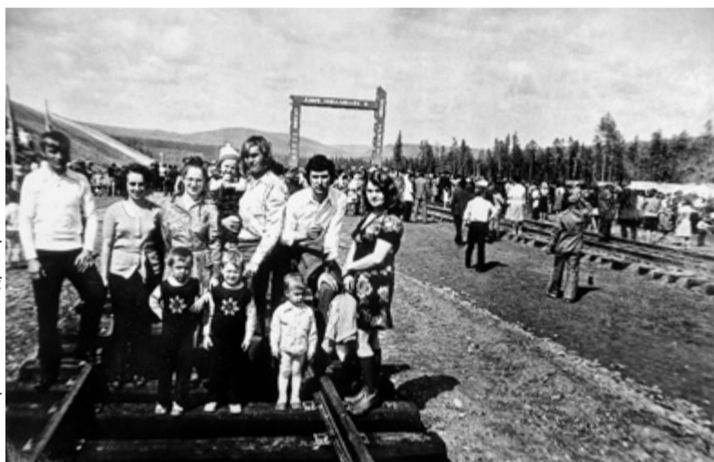
Донские специалисты очень многое сделали для создания и обустройства на БАМе поселка Магистрального в Иркутской области

За несколько лет работы на БАМе силами донского отряда и влившихся в него специалистов подготовили часть территории под поселок: вырубали деревья, выровняли площадку, забили сваи для строительства домов. Возвели несколько жилых домов (в том числе почти достроили четырехэтажный кирпичный), клуб, котельную, протянули водовод от реки Киренга. Был создан и большой растровый узел, благодаря ему получали бетонные и растворные смеси для будущих работ.