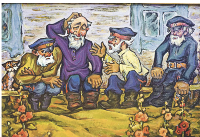
Куда же на такой выставке без местного колорита (работа Виктора Карпиновича «Станичники»)

Плакаты Алексея Курманаевского поздравляет Ростов-на-Дону с очередным днем рождения, представляя известный памятник архитектуры, здание городской Думы, в виде именного торта со свечками.