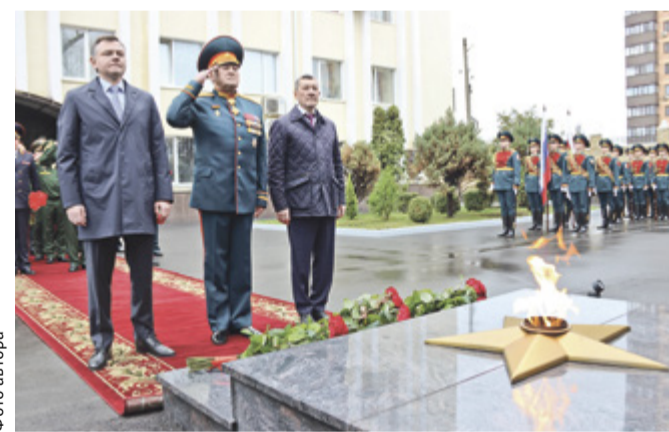
■ К Вечному огню на территории Южного округа Росгвардии возложили цветы