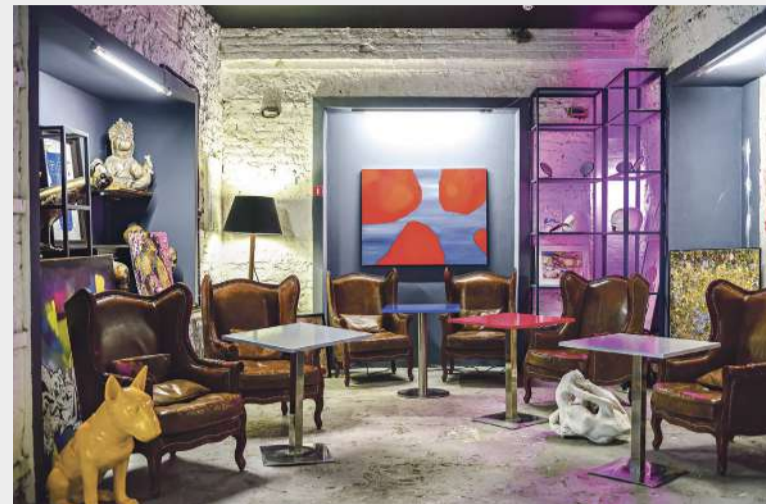
Один из интерьеров новой «Макаронки»

В Ростове состоится официальное открытие первого сезона театрально-выставочного центра (так теперь будет называться бывший арт-центр).