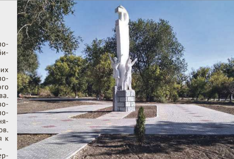
В Алексеевке на улице Ленина закончены работы по благоустройству зоны отдыха