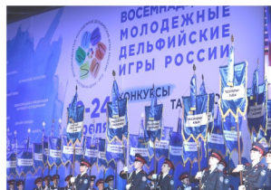
Восемнадцатые молодежные дельфийские игры России