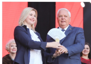
Всероссийский театральный марафон в Ростовской области