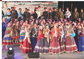
Всероссийский литературно- фольклорный фестиваль «Шолоховская весна»