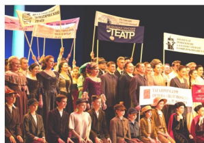
Церемония открытия Года театра России в Ростовской области