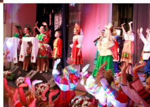
Церемония открытия Года народного творчества в Ростовской области