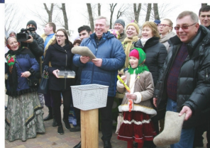
Областной праздник «Масленица»