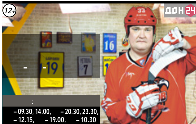
- 09.30, 14.00, - 20.30, 23.30, - 12.15, - 19.00, - 10.30